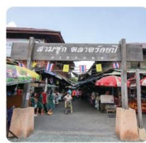
ตลาดสามชุก