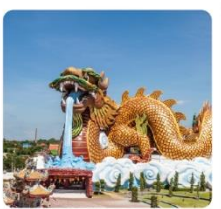
หมู่บ้านมังกรสวรรค์