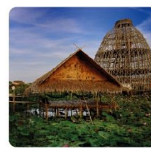
ตลาดน้ำสะพานโค้ง