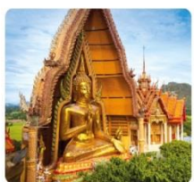
วัดท่าเสือ