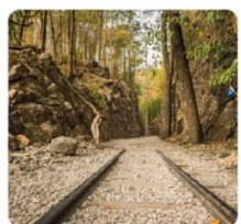
ช่องเขาขาด