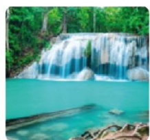
น้ำตกธาราฉัตร