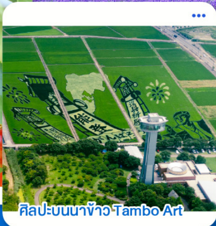
ศิลปะบนนาข้าว Tambo Art

ชิโตเสะ · อาซาฮิกาวะ · บิอะ · ฟุราโนะ · โอดารุ · ซัปโปโร