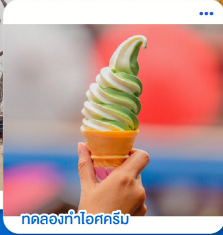
ทดลองทำไอศกรีม

โนโบริบดลี · ไทยะ · นิชโกะ · โอตารุ · ซัปโปโร · ชิโตเสะ