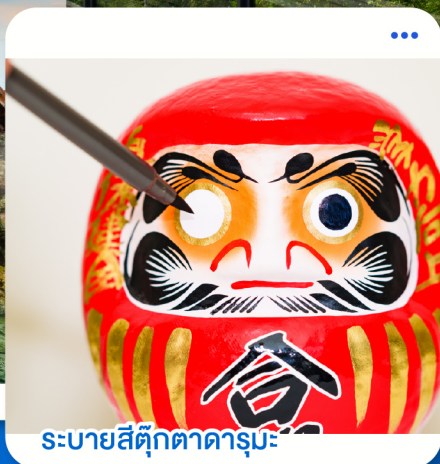
ระบายนี่ดีทุกตาแดร์นะ

โตเกียว · คุซัทสึ · นากาโน่ ฮาคุบะ · ยามาโนชิ · โตเกียว