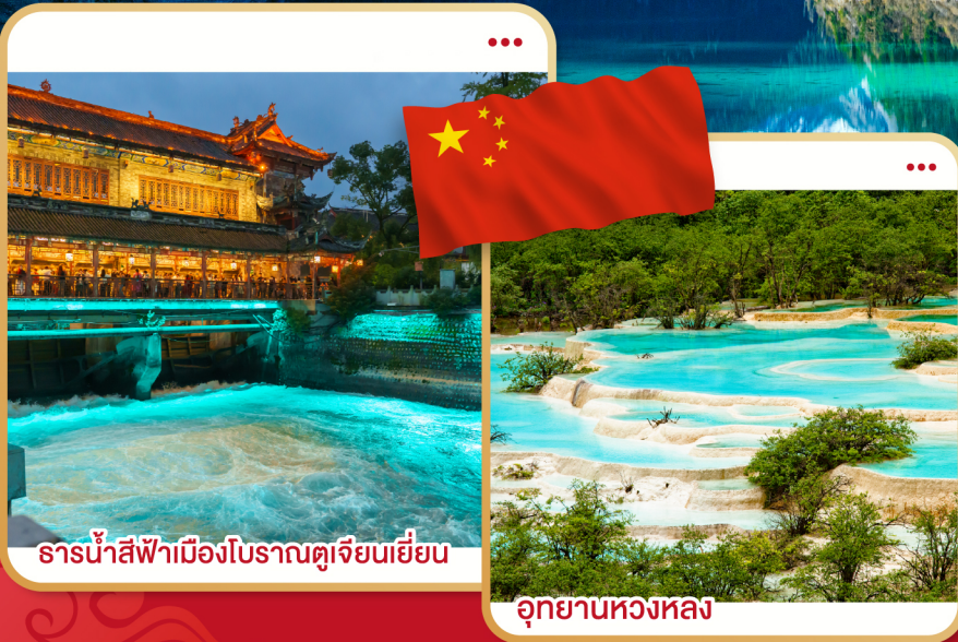
ธารน้ำสีฟ้าเมืองโบราณตูเจียงเยียน