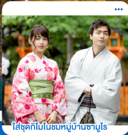
ใส่ชุดกิโมโนชมหมู่บ้านชามูโร

ฮานดะ · อาโอโมริ · อิวาเตะ · เซ็นได · โตเกียว (นั่งรถไฟชินคันเซ็น)