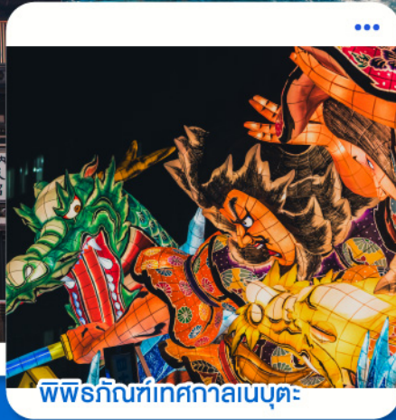
พิพิธภัณฑ์เทศกาลลนบุดะ

ฮานดะ · อาโอโมริ · โทวะดะ · อิวาเตะ · ยามากะตะ · เซ็นได · โตเกียว