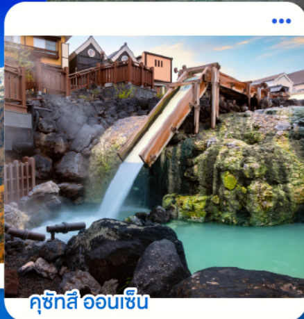
คุซัทสึ ออนเซ็น

กุมมะ · นิงาตะ · คุซัทสึ · นากาโนะ · ฮาคุบะ · โตเกียว