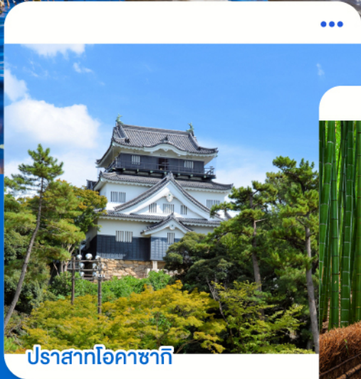
ปราสาทโอซากาชิ